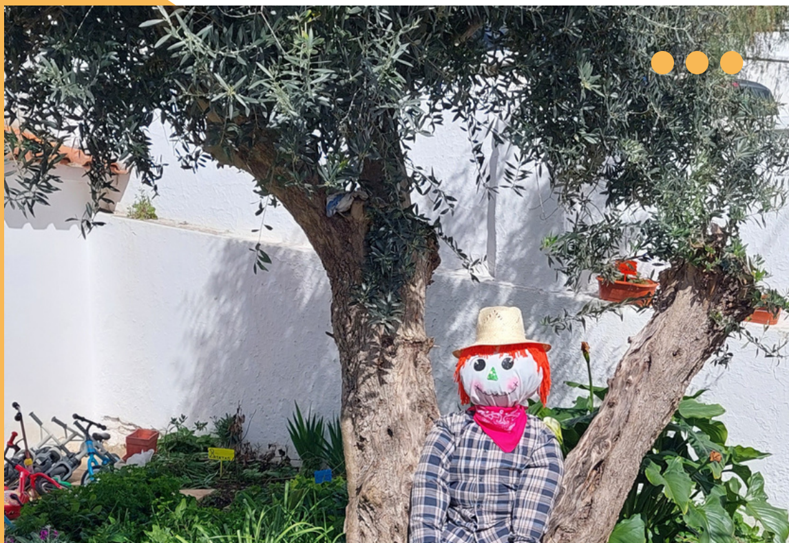
ESTE É O ZACARIAS - PRÉ-ESCOLAR DE RELIQUIAS