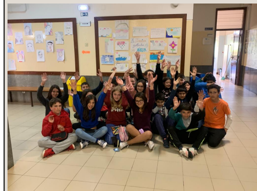
Painel com os trabalhos produzidos pelos alunos

Curiosamente é uma nova disciplina no âmbito do